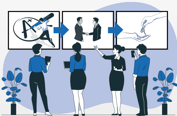
Abbildung: Nameshield / Storyset.com